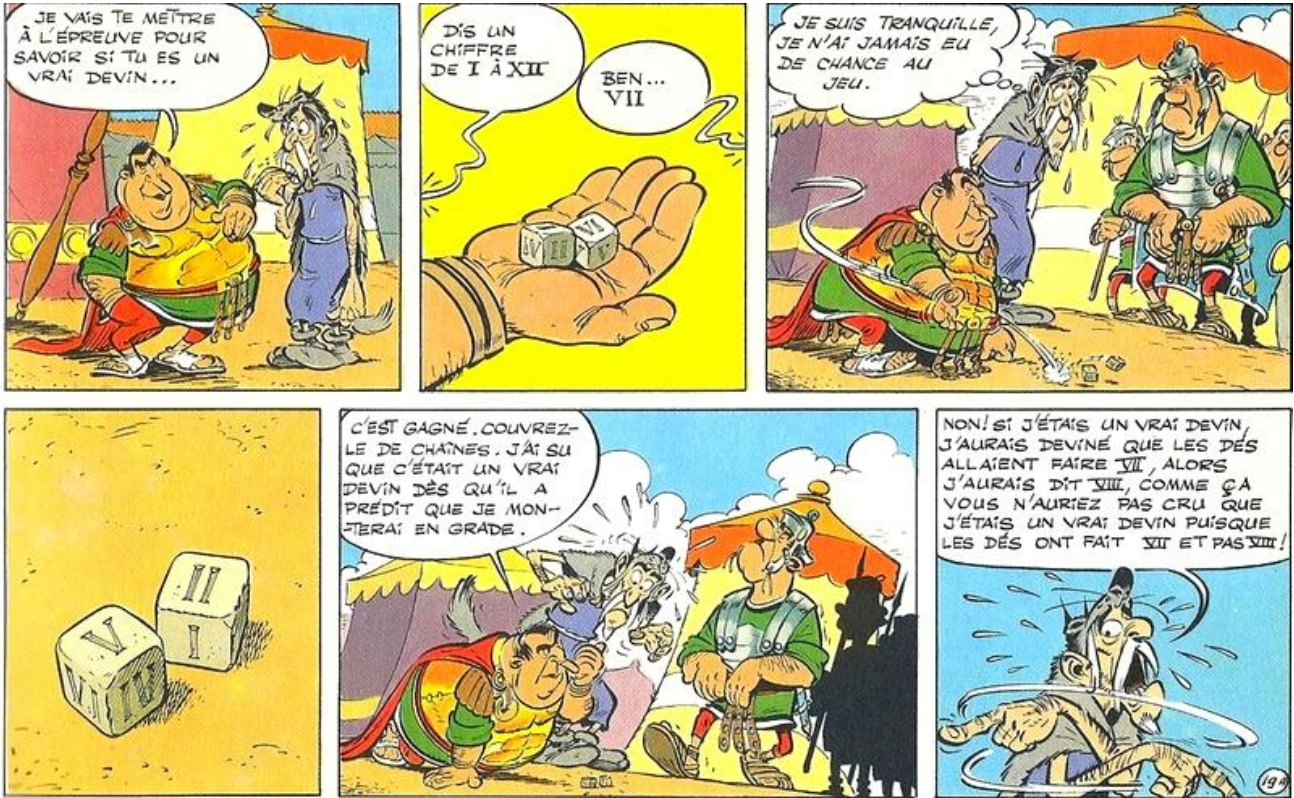
Document 2 (Astérix le Gaulois, Le Devin, Uderzo & Goscinny, MCMLXXII)